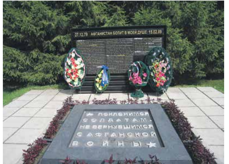
Афганистан. Саперы. Середина 1980-х годов.

Служба моя идет помаленьку. Сейчас мы ставим в горах точку, так что времени совсем нет. Встаем в 4 часа и весь день проверяем вокруг. Ну вот, наверное, и все, что я могу написать про свою службу. Правда, лишнего писать не полагается. Ну, о своем здоровье, на него я правда не жалуясь. Пока